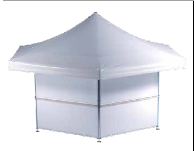
Polycarbonat-Paneele zur Sicherung über Nacht

Natürlich eignen sich auch die Paneelen der Nachtabsperrung, bedruckt nach Ihren Wünschen, als Werbeträger.